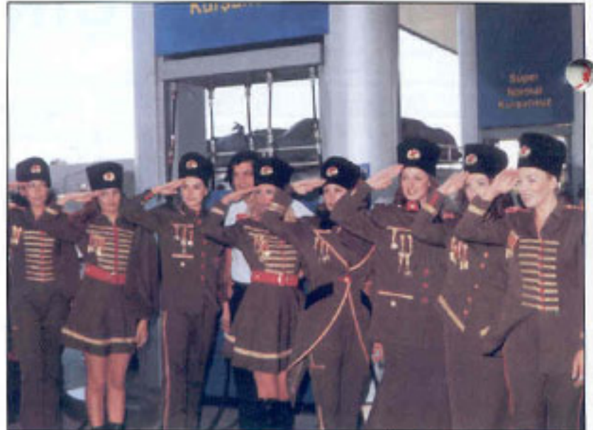
En güzel Kuvva'cılar

Bu tesislerden yapacağınız her alışveriş kahraman Mehmetçiğimizin dul-yetim ve gazilerine hizmet olarak geri dönecektir.